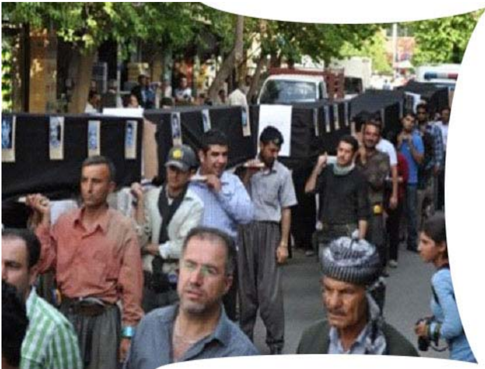
سلیمانی... مه‌راسیمیک بۆ قوربانیانی نه‌بوونی سه‌لامه‌تی پیشه‌یی 2012

7. بیانوه‌کانی عێراق بۆ په‌سند نه‌کردنی ریککه‌وتننامه‌کانی ته‌ندروستی و سه‌لامه‌تی پیشه‌یی ژماره 155 و ریککه‌وتننامه‌ی خزمه‌تگوزاری ته‌ندروستی پیشه‌یی ژماره 161 و ریککه‌وتننامه‌ی 187 ی تایه‌ت به‌ چوارچێوه‌ی هاندان بۆ ته‌ندروستی و سه‌لامه‌تی پیشه‌یی ریکخراوی کاری نیوده‌وله‌تی، بریتیه‌ له نه‌بوونی یاسای کاری گونجاو، له‌ کاتیکدا پیمانوايه ئه‌م بیانوه‌ ماوه‌یه‌کی زۆری به‌سه‌ردا تێپه‌ریوه و ده‌کرێ عێراق لێی ده‌رباز ببێت، هاوکات داوا له ئه‌نجومه‌نی نوێنه‌رانی عێراقی ده‌که‌ین پرۆسیجه‌ری په‌سندکردنی ئه‌و ریککه‌وتننامه‌نه‌ خیراتر بکری و له‌ نزگترین کاتدا پێداویسته‌یه‌کانی جێبه‌جێکردنیان له‌ عێراقدا بۆ فه‌راهه‌م بکری. به‌مه‌ش ده‌توانی گیانی ملیونه‌ها کریکار له‌ عێراقدا له‌ مه‌ترسیه‌کانی کارکردن بپاریزی.